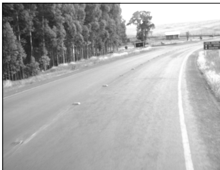
Acidente ocorreu no trevo secundário de acesso a BR 468

go, dia 23, por volta das 5h20min, no quilômetro 32 da RS-317, em Coronel Bicaco. Ela estava na coroa de uma moto Honda Twister conduzida pelo indivíduo com iniciais LPA de 19 anos, que trafegava no sentido Redentora - Coronel Bica-